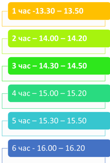
График на часовете за обучение от разстояние