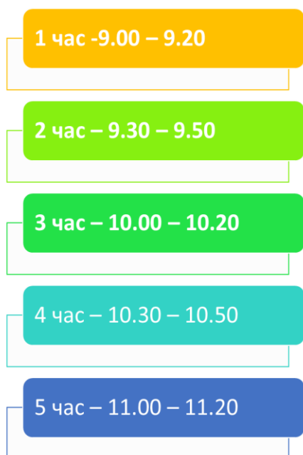
График на часовете за обучение от разстояние